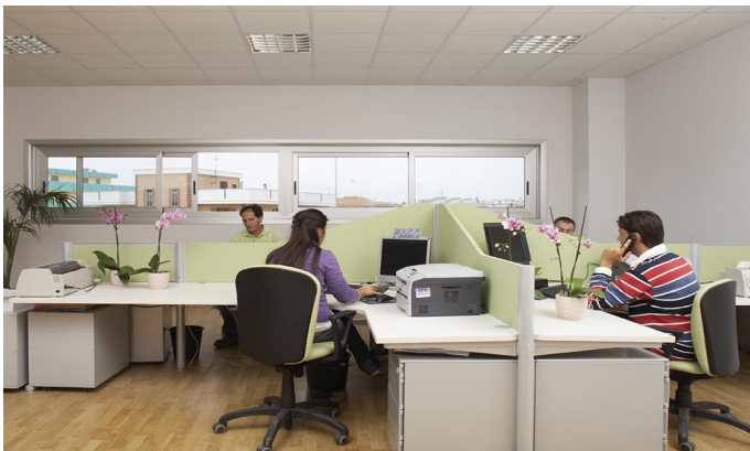
Piante sul posto di lavoro

Chi desidera offrire un salubre aiuto a se stesso, ai propri colleghi e all'azienda, si preoccuperà che